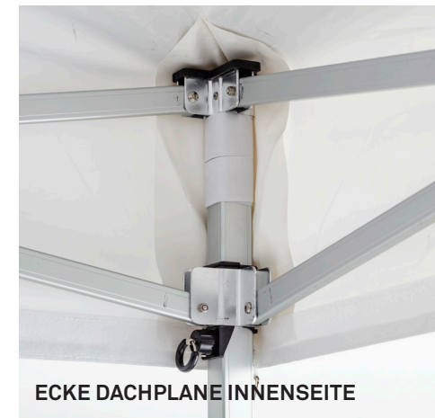
ECKE DACHPLANE INNENSEITE