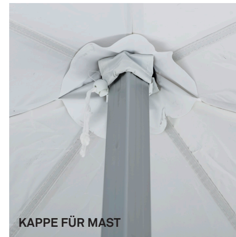
KAPPE FÜR MAST