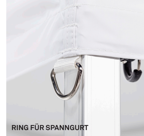
RING FÜR SPANNGURT